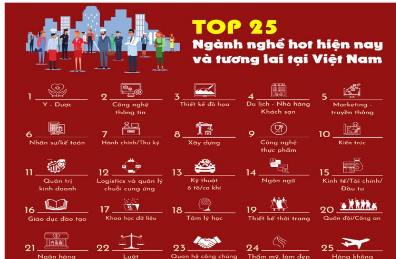
Hình 3. Các ngành nghề thu hút người lao động ở Việt Nam (Định Thị Diệu, 2023).

Ví dụ: trong bài “việc làm” : Giáo viên có thể lựa chọn các dữ liệu để hướng dẫn học sinh phân tích xác định những nghề nghiệp có xu hướng hướng phát triển mạnh trong tương lai.