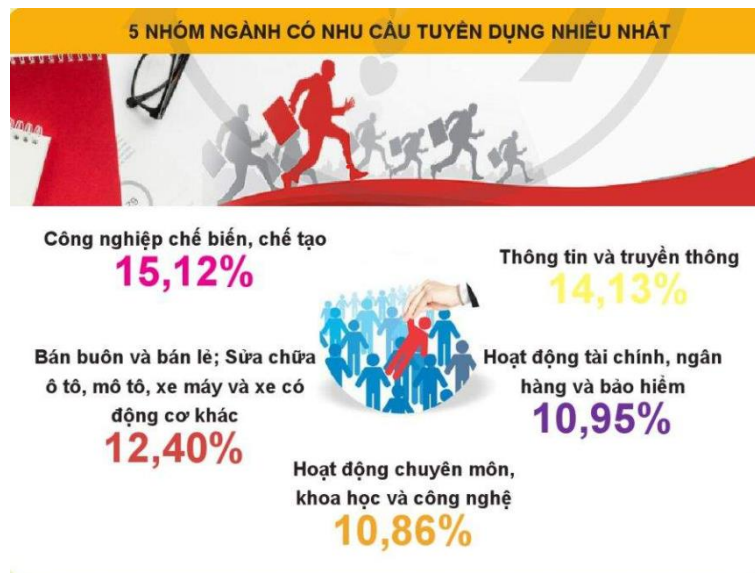
Hình 1. Nhóm ngành được tuyển dụng nhiều nhất (Sách giáo khoa, 2022).

Ví dụ: thông qua bài Thị trường lao động: Giáo viên hướng dẫn học sinh đánh giá số liệu thống kê về thị trường lao động khi đánh giá các nhóm nghề nghiệp được tuyển dụng nhiều nhất hiện nay để học sinh có thông tin chính xác về nhu cầu của xã hội