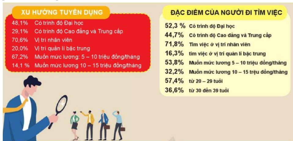
Hình 2. Thống kê tuyển dụng lao động theo trình độ đào tạo (Sách giáo khoa, 2022).

Đồng thời phân tích nhu cầu các ngành nghề về trình độ đào tạo để học sinh đưa ra mục tiêu, các kế hoạch liên quan đến quá trình học tập, đào tạo của bản thân.